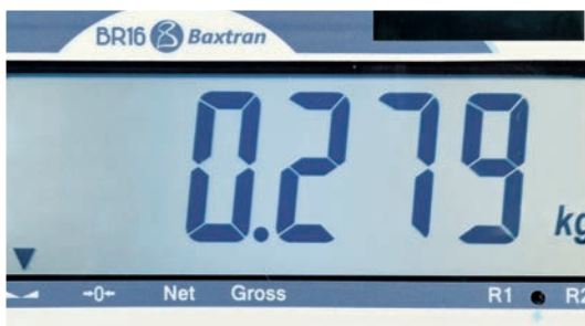
PANTALLA LCD RETROILUMINADA